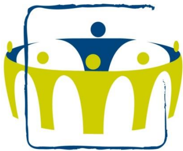
meer burger, minder overheid

In het beleidsplan Om Elkaar zijn de volgende vijf uitgangspunten opgenomen als leidend voor het sociaal domein: