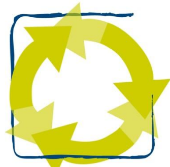
Meer preventief, minder curatief