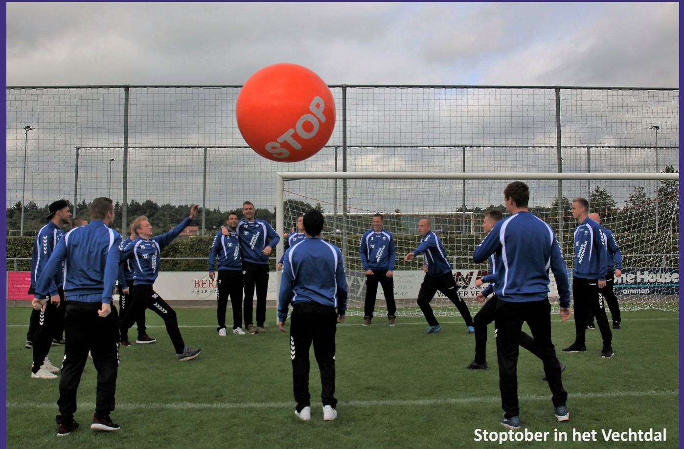
Stoptober in het Vechtdal

We kiezen voor een compacte weergave, omdat we vooral willen doen. Het verschil voor onze regio maken we niet in de plannen, maar in de uitvoering!