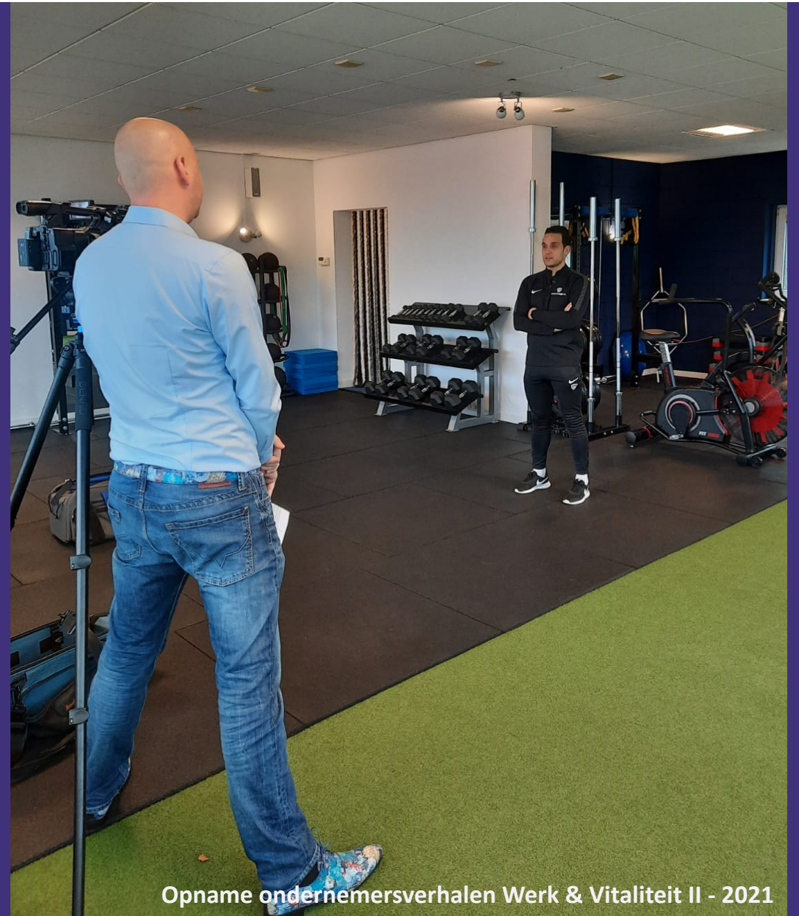
Opname ondernemersverhalen Werk & Vitaliteit II - 2021